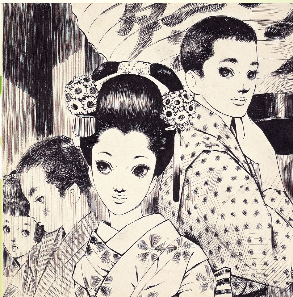
中原淳一ペン画「たけくらべ」

樋口一葉「たけくらべ」(山梨県立文学館蔵) 樋口一葉から半井桃水宛書簡(浅草 鷲神社蔵) など、 「たけくらべ」に関連した貴重な資料を期間限定で展示致します。