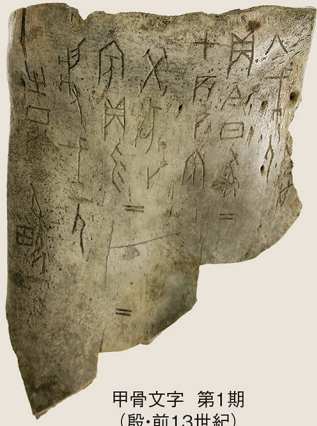
甲骨文字 第1期 (殷・前13世紀) 通期展示

動物の骨や亀の甲羅に刻された、現存最古の漢字といわれる甲骨文字は、今から3500年ほど前に使われていました。漢字は、読みやすさや書きやすさ、そして美しさなどが模索されながら、その時代に最もふさわしい形で表現され、発展していきました。本展では、甲骨文字や青銅器の文字、石碑の文字など、中村不折コレクションから、ホンモノの考古品で漢字のはじまりについて解き明かします。