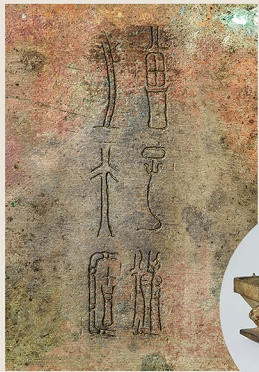
曾子選簋 (春秋・前5世紀) 通期展示