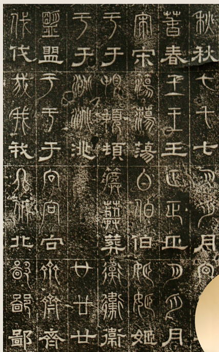
三体石經 第三石 (三国 魏・正始年間/240~248) 後期展示