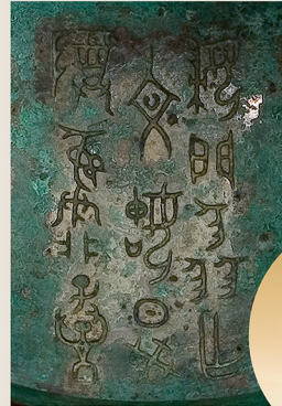
婦鬲卣 (西周・前10世紀) 通期展示