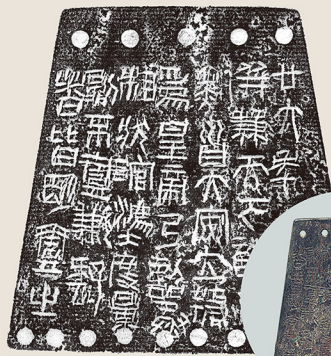
秦詔版 (秦・前221) 前期展示