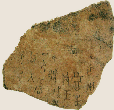
甲骨文字 第5期 (殷・前11世紀) 後期展示