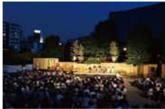
「昨年の様子」