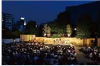
「過去の公演の様子」