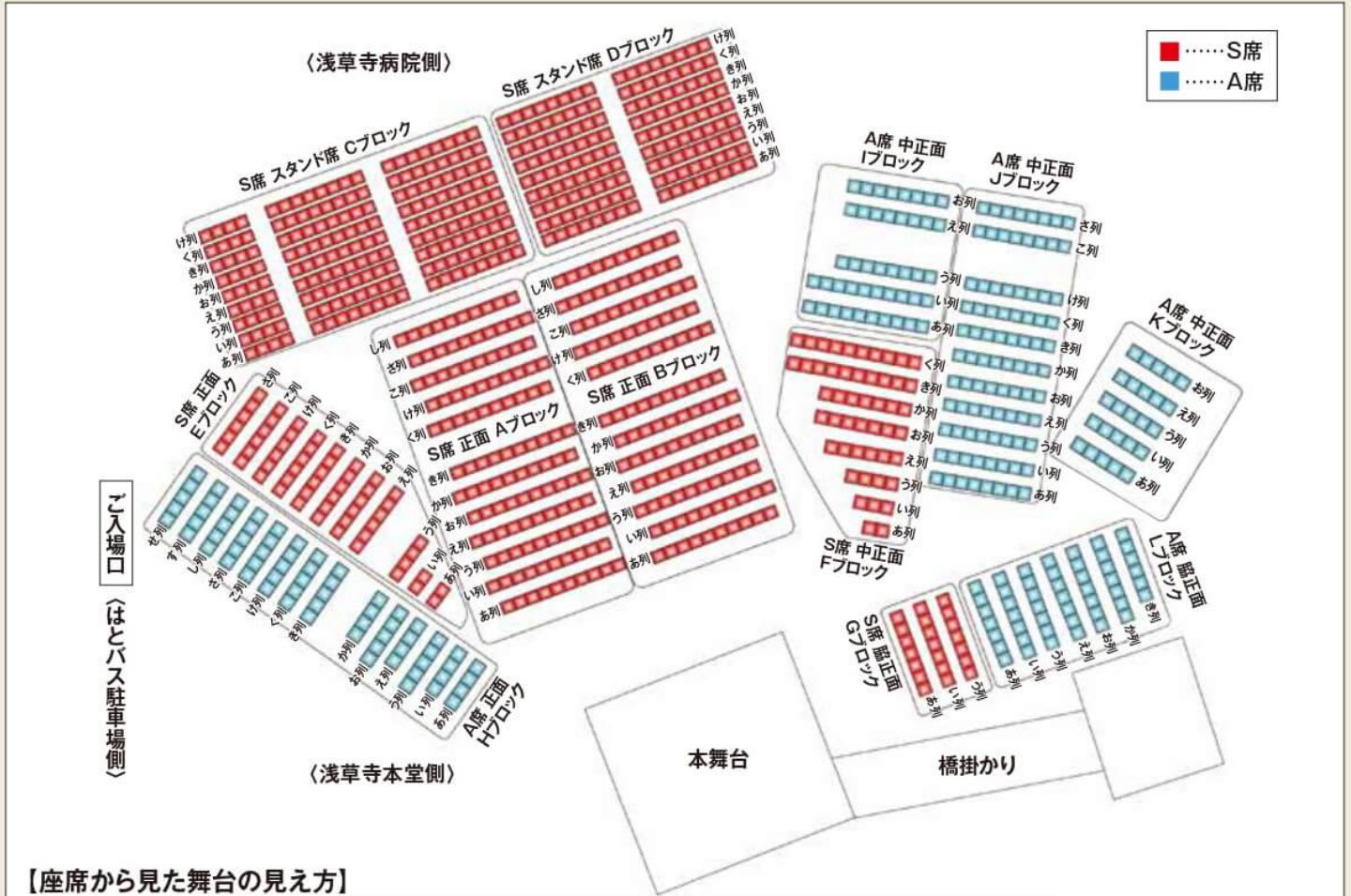
【座席から見た舞台の見え方】