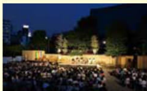
「過去の公演の様子」